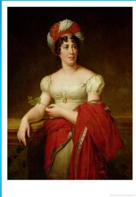
ÉTIENNE DE SENANCOUR