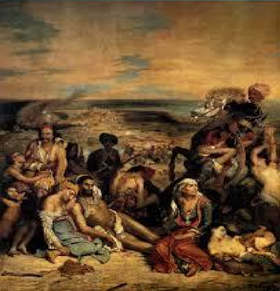
Eugène Delacroix ( “Scènes des massacres de Scio” ).