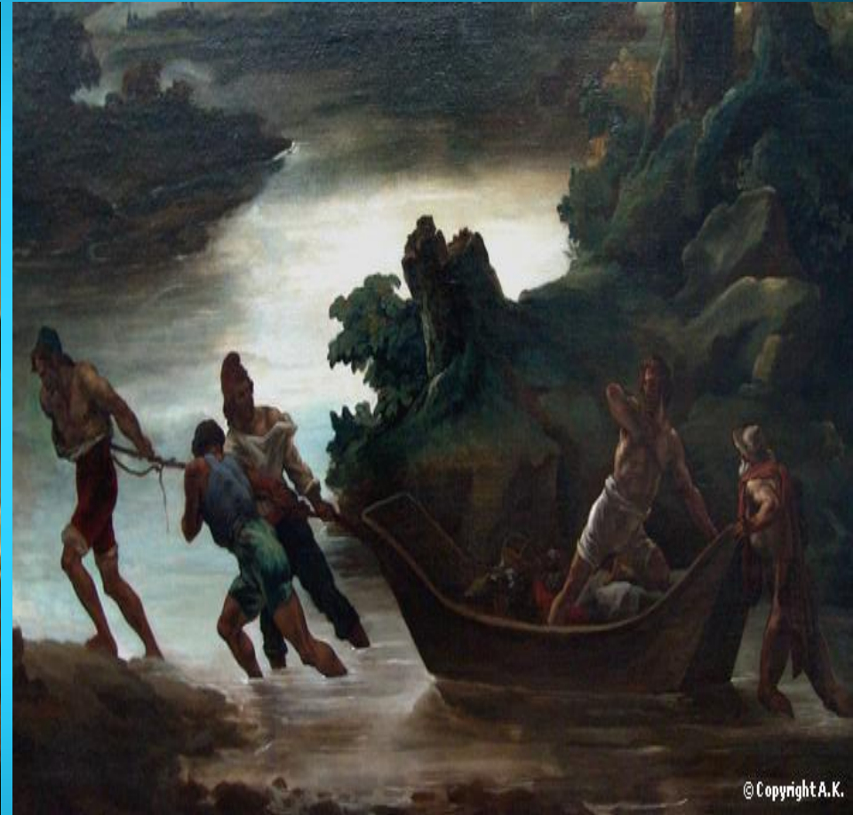
Théodore Géricault (Le Radeau de la Méduse)