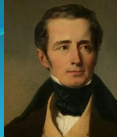
ALPHONSE DE LA MARTINE