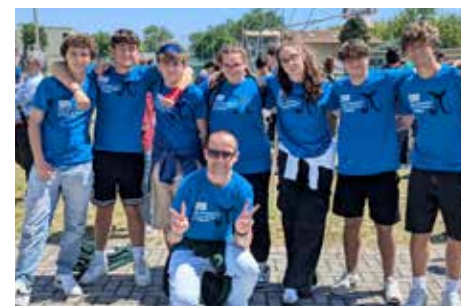
Finali Nazionali individuali e a squadre di Matematica, Cesenatico