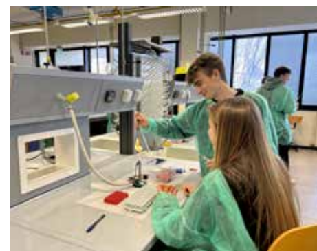
Attività di laboratorio presso UNIVPM

> Progetti di Digital Design inseriti nel percorso disciplinare di Art and Design.