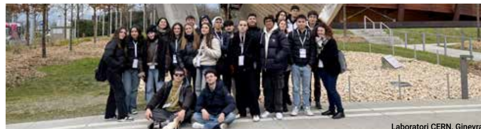
Laboratori CERN, Ginevra

Il corso è autorizzato dall'Università di Cambridge e permette il conseguimento degli International General Certificate of Secondary Education (IGCSE), gestiti appunto da Cambridge. Il curriculum prevede, fino al terzo anno, lo svolgimento di stage linguistici all'estero per approfondire e consolidare le competenze comunicative nella lingua inglese.