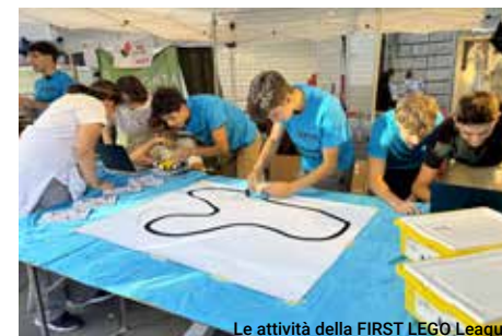
Le attività della FIRST LEGO League

Dall'anno scolastico 2021/22 il nostro indirizzo informatico prevede il syllabo Cambridge IGCSE, con l'introduzione di un'ora di Computer Science in lingua inglese e la possibilità di conseguire la certificazione IGCSE con esame in quarta, rilasciata da University of Cambridge - Cambridge Assessment International Education.